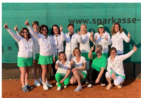
Damen 40 II