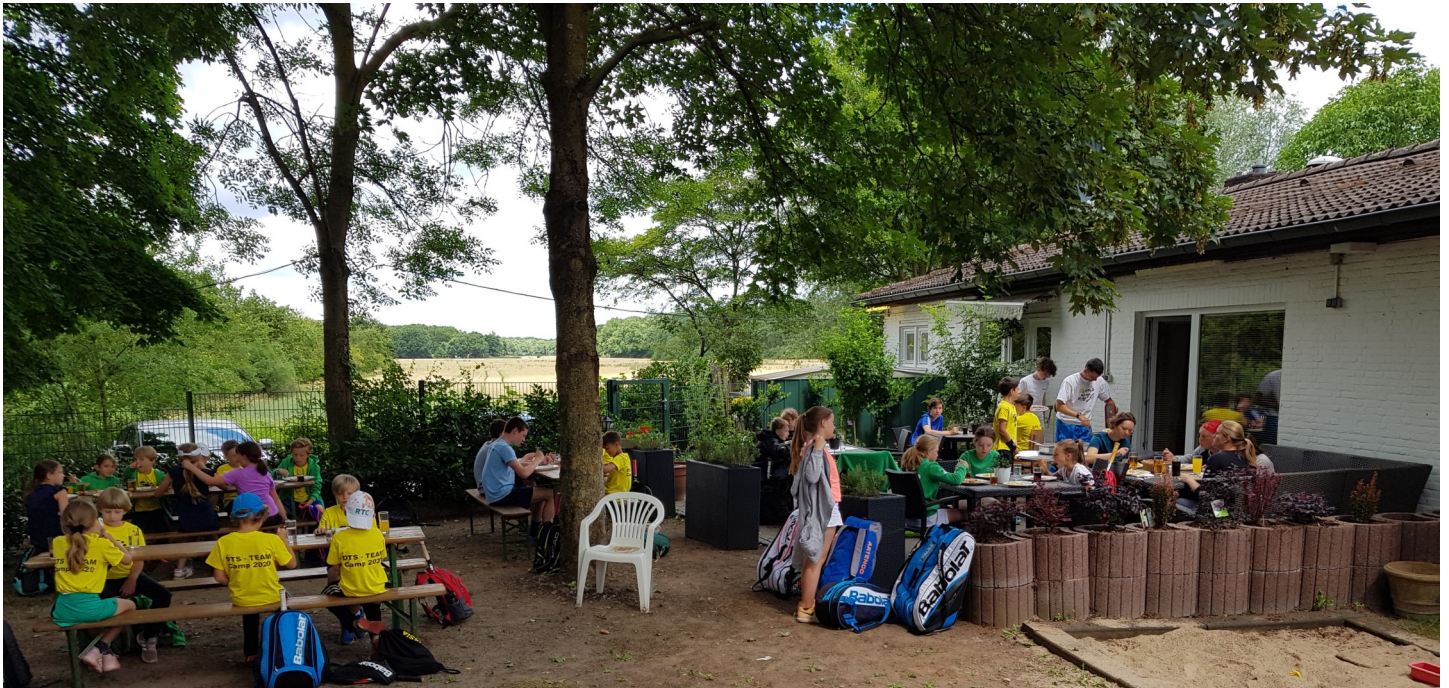
Das DTS-Tenniscamp bei der Mittagspause auf der hinteren Terrasse.